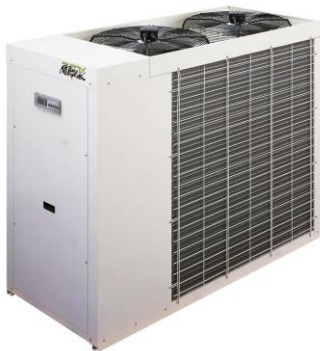
Impianto con 2 ventole espulsione aria superiore