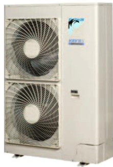
Impianto con 2 ventole espulsione aria frontale